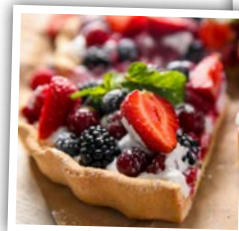
La tarte aux fruits

Les + de 50 ans affichent leurs préférences pour des recettes plus « traditionnelles » comme la tarte aux fruits (2 e du classement des 50 à 64 ans et 1 ère chez 65 ans et plus), le clafoutis (2 e du top des 65 ans et plus) ou le baba au rhum qui apparaît en 3 e position de ces deux catégories.