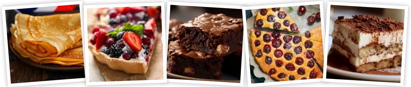
1 La crêpe