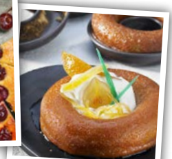
Le baba au rhum