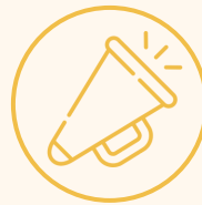
Sensibilisation de la jeunesse

Sont préconisés par les 60 ans et plus et les 18-30 ans